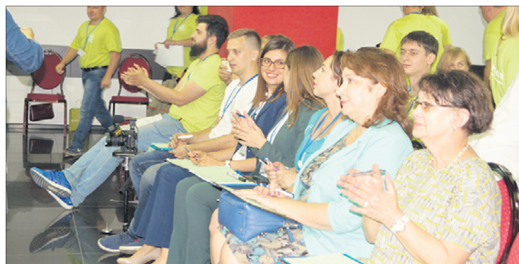
Фото с фестиваля на сайте Федерации профсоюзов области http://chelprof.ru в рубрике «Медиаотека» - «Фотогалерея»

Ирина Келлерман, пресс-центр ДОРПРОФЖЕЛ ЮУЖД